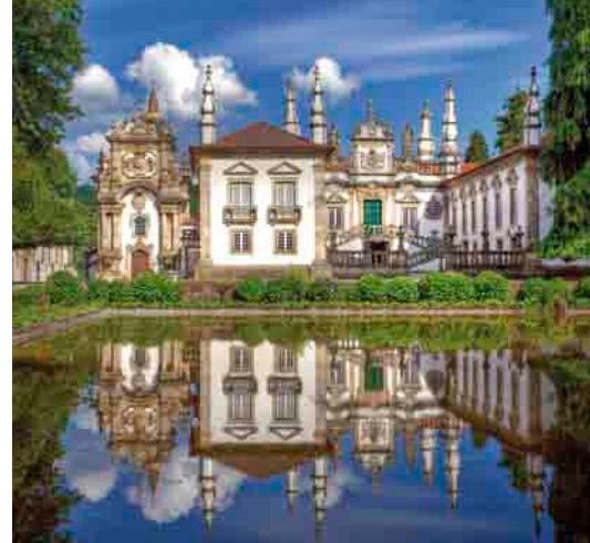
Vila Real, Mateuspalast

Am Vormittag sollten Sie unseren Ausflug nach Figueira de Castelo Rodrigo nicht verpassen! Die auf 670 Höhenmeter gelegene Stadt ist eine von Portugals 12 historischen Kirchengebunden. Die mittelalterlichen, engen Gassen beherbergen noch heute Fassaden aus dem 16. Jahrhundert sowie Fenster im berühmten Manuelino Stil. Eine weitere Besonderheit von Figueira de Castelo Rodrigo sind die stolzen Störche, welche die Stadt für volle neun Monate im Jahr als ihr Zuhause ansehen. Wieder an Bord geht die Kreuzfahrt stromabwärts weiter